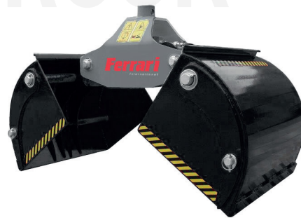
VERSIONE PARETI SMONTABILI OPTIONAL DISMOUNTABLE SIDES OPTIONAL VERSION