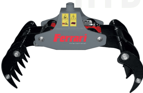
VERSIONE DENTI ADDIZIONALI DI SERIE ADDITIONAL TEETH STANDARD VERSION